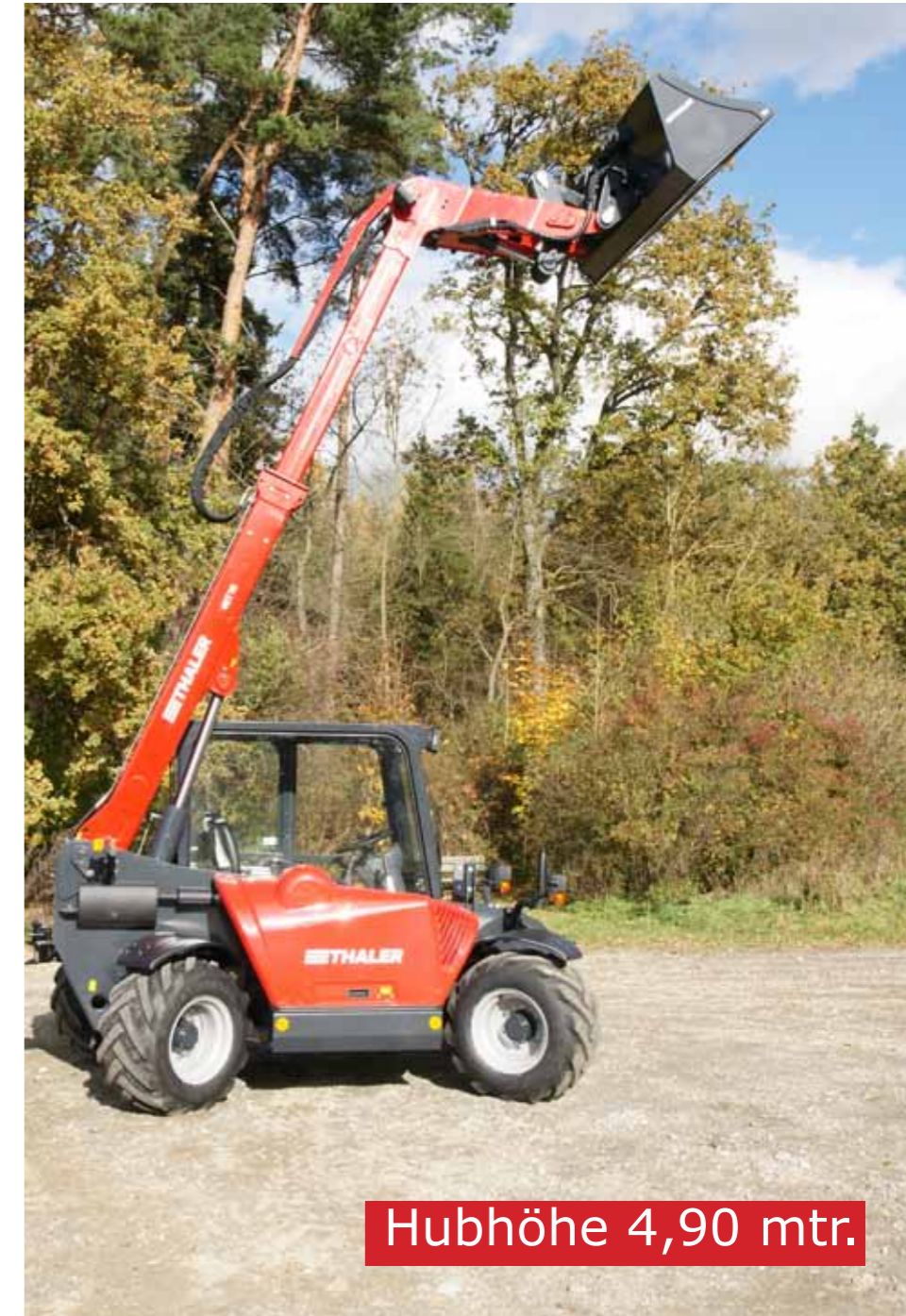
Hubhöhe 4,90 mtr.